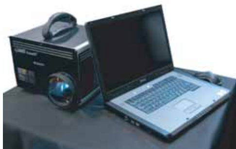
17インチ立体ディスプレイ

★Cube3D 2 での立体表示には下記製品との併用が大変便利です。 専用のスクリーンが不要のため、このセットだけで立体視の環境を実現できます。